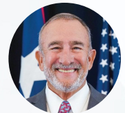
Hon. Manuel Cidre DDEC

4:30 PM ➤ CLAUSURA Sorteo ¡Quédate hasta el final!