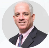
Dr. Graham Castillo, Economista

1:15 PM ➤ Tendencias en el flujo migratorio: Comportamiento de la diáspora en Estados Unidos